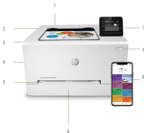
Foto: HP Color LaserJet Pro M255dw