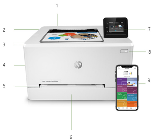
Foto: HP Color LaserJet Pro M255dw