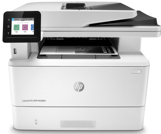
HP LaserJet Pro MFP M428fdn

Liiketoiminnassa menestyminen edellyttää älykkäitä työskentelytapoja. HP LaserJet Pro MFP M428 -monitoimilaitteen suunnittelu auttaa sinua käyttämään aikasi tärkeisiin asioihin: liiketoiminnan kasvattamiseen ja pysyäkseen kilpailussa askeleen edellä.