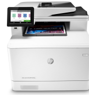
Impresora HP Color LaserJet Pro M479fnw

Esta impresora está diseñada para funcionar solo con cartuchos que dispongan de un chip de HP nuevo o reutilizado, y utiliza medidas de seguridad dinámica para bloquear los cartuchos que usan un chip que no sea de HP. Las actualizaciones periódicas de firmware mantienen la eficacia de estas medidas y bloquean los cartuchos que funcionaban anteriormente. Un chip de HP reutilizado permite el uso de cartuchos reutilizados, rellenados o reacondicionados. Más información en: http://www.hp.com/learn/ds