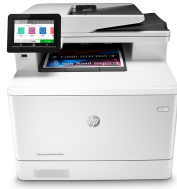
Impresora HP Color LaserJet Pro M479dw

El éxito profesional es sinónimo de una forma de trabajo más inteligente. La impresora multifunción HP Color LaserJet Pro M479 se ha diseñado para que puedas centrarte más en el crecimiento de tu empresa y situarte un paso por delante de la competencia.