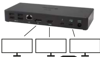
3 monitory pripojené cez 1x DisplayPort, 1x HDMI a 1x Thunderbolt 3 káble rozlíšenie až 4K 4096x2160@30Hz .

Veľkosť rozlíšenia, snímkovacia frekvencia a maximálne množstvo pripojených externých monitorov je závislá na možnostiach hostiteľského PC/NB.