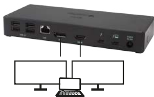
2 monitory připojeny zároveň 1x DisplayPort a 1x HDMI rozlišení max. 4K 4096x2160@60Hz