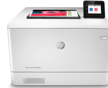
Tiskárna HP Color LaserJet Pro M454dw

Tato tiskárna je určena k použití pouze s kazetami, které mají nový nebo opakovaně použitý čip HP, a využívá dynamická bezpečnostní opatření k blokování kazet s čipem jiného výrobce než HP. Pravidelné aktualizace firmwaru zajistí zachování účinnosti těchto opatření a zablokování kazet, které dříve fungovaly. Opakovaně použitý čip HP umožňuje využívat opakovaně použité, recyklované a znovu naplněné kazety.