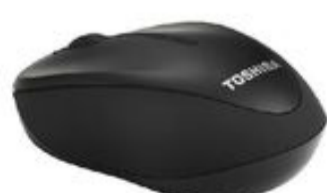
Ratón óptico inalámbrico MR100 (PA5243E-1ETB)