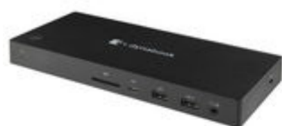
Docking USB-C (PA5356E-1PRP)