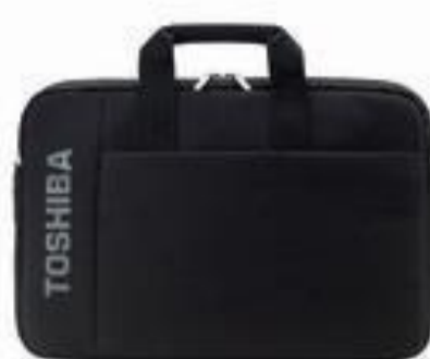
Maletín para portátil B116 (PX1880E-1NCA)