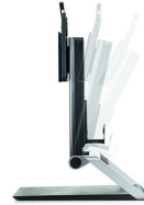
مركز العمل المتكامل لكمبيوترات Mini المكتبية وأجهزة Thin Client التابعة جزئيًا من HP

استخدم مساحات العمل الصغيرة على أفضل وجه ممكن مع كمبيوتر Mini المكتبية/جهاز Thin Client التابع جزئيًا الخاص بمركز العمل المتكامل من HP والذي يتيح لك كل منهما إنشاء حل مكتبي صغير الحجم عن طريق استخدام شاشة عرض [1] مع كمبيوتر Mini المكتبية أو جهاز Thin Client التابع جزئيًا من HP أو HP Chromebox [1]. مما يمنحك الوصول المرير إلى جميع المدخل الأمامية الخاصة بالجهاز. رقم المنتج: G1V61AA