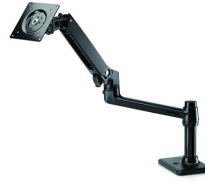
ذراع جهاز عرض فردي من HP

يعتبر ذراع HP لتركيب شاشة عرض واحدة ملحقاتًا مكتبية مثاليًا لحياتك العملية. أنيق ومبسط، إن ذراع HP لتركيب شاشة عرض واحدة تم تصميمه لملاءمة أسلوب العمل الخاص بك. رقم المنتج: BT861AA