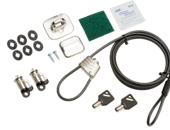
طقم قفل أمان لأجهزة الكمبيوتر للأعمال HP v3

ساعد في منع العبث بالهيكل وتأمين جهاز الكمبيوتر والشاشة في مساحات العمل والأماكن العامة باستخدام طقم قفل الأمان للكمبيوتر الشخصي للأعمال HP v3 ذي السعر المناسب. رقم المنتج: 3XJ17AA