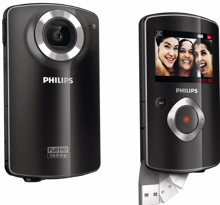
Philips Câmara de filmar HD