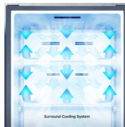
Multi Air Flow

Grâce au metal cooling, votre réfrigérateur descendra en température plus rapidement, la stabilité de la température sera améliorée et il bénéficiera d'un design plus contemporain.