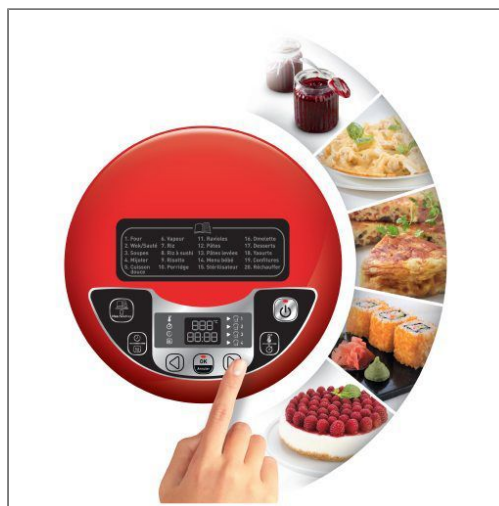
MULTICUISEUR 15 EN 1 MK708E10