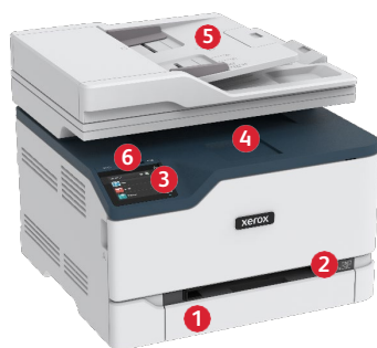
Stampante multifunzione a colori Xerox® C235