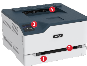
Impressora a cores Xerox® C230