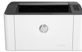
HP Laser 107w

Cette imprimante a été conçue pour fonctionner uniquement avec des cartouches disposant d'une puce HP neuve ou réutilisée. Elle est équipée d'un dispositif de sécurité dynamique pour bloquer les cartouches intégrant une puce non-HP. Les mises à jour périodiques du micrologiciel permettent d'assurer l'efficacité de ces mesures et bloquent les cartouches qui fonctionnaient auparavant. Une puce HP réutilisée permet d'utiliser des cartouches réutilisées, reconditionnées ou recyclées. Plus d'informations sur : http://www.hp.com/learn/ds