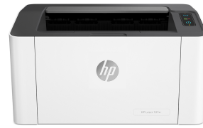
HP Laser 107w

Cette imprimante a été conçue pour fonctionner uniquement avec des cartouches disposant d'une puce HP neuve ou réutilisée. Elle est équipée d'un dispositif de sécurité dynamique pour bloquer les cartouches intégrant une puce non-HP. Les mises à jour périodiques du micrologiciel permettent d'assurer l'efficacité de ces mesures et bloquent les cartouches qui fonctionnaient auparavant. Une puce HP réutilisée permet d'utiliser des cartouches réutilisées, reconditionnées ou recyclées. Plus d'informations sur : http://www.hp.com/learn/ds