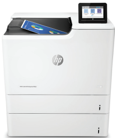
HP Color LaserJet Enterprise M653x