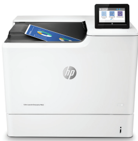
HP Color LaserJet Enterprise M653dn

Cette imprimante HP Colour LaserJet avec JetIntelligence allie des performances exceptionnelles et une efficacité énergétique pour des documents de qualité professionnelle selon vos besoins, tout en protégeant votre réseau avec la plus grande sécurité du secteur. 1