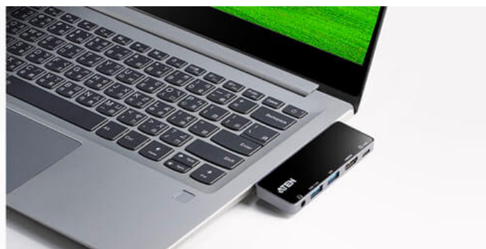
Bärbar dator med Windows