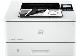
HP LaserJet Pro 4002dwe Printer

Esta es una impresora HP+. Requiere una cuenta HP, conexión a Internet permanente y el uso exclusivo de los cartuchos de Tóner Original HP durante la vida útil de la impresora. http://www.hp.com/plus-faq