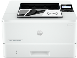
HP LaserJet Pro 4002dne Printer

Esta impresora se ha diseñado para ofrecer la máxima productividad gracias a la fiabilidad del hardware y a las rápidas velocidades que alcanza. Utilízala fácilmente desde donde trabajes para que puedas centrarte en tu actividad comercial. Con HP+, nunca ha sido tan fácil gestionar y utilizar las impresoras desde cualquier parte.