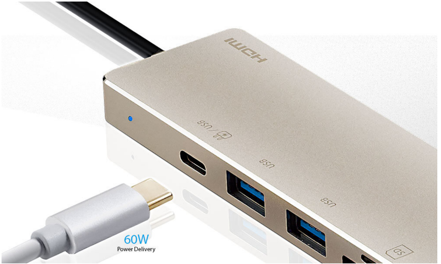
Una docking station para expandir todos tus dispositivos