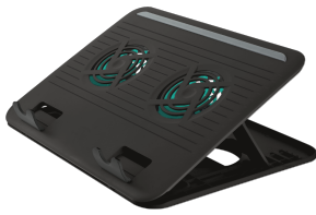
PRODUCT VISUAL 1