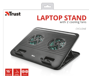
PACKAGE FRONT 1