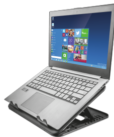
PRODUCT EXTRA 1