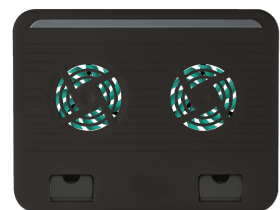
PRODUCT TOP 1