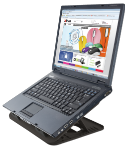
PRODUCT VISUAL 3