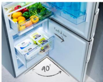
Ouverture à 90° sans débord

Grâce à l'ouverture de porte sans débord, il est désormais possible d'installer le réfrigérateur directement contre un mur. Il est également possible d'utiliser l'ensemble des tiroirs en toute simplicité.