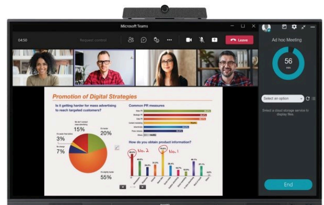
* AV Soundbar PN-ZCMS1 optional